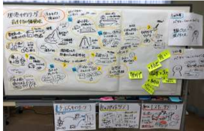
那須サイクリングの高付加価値化に向けて (コンソーシアムメンバーのグラレコ)

サイクリストの来訪者数の増加や再訪率の向上により消費額を増大させることで、地域にとって持続可能な収益モデルとして確立させることを目指す。