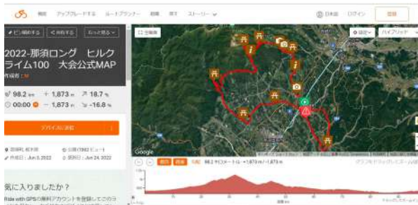
那須サイクリングコース (イメージ)